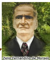
Zélio Fernandino de Moraes

Nasceu em 10 de Abril de 1891 e desencarnou no dia 03 de Outubro de 1975. Zélio aos 17 anos idade, estava prestes a ingressar na carreira militar da Marinha do Brasil, quando foi acometido por uma inexplicável paralisia que o impossibilitou de caminhar. Os médicos na época não sabiam explicar o ocorrido. Certo dia, ergueu-se no leito, declarando: " Amanhã estarei curado! " No dia seguinte, de fato, levantou-se normalmente e voltou a caminhar, como se nada lhe houvesse acontecido: os médicos não souberam explicar o ocorrido. Os seus tios, padres da Igreja Católica, surpreendidos, também não souberam explicar o fenômeno. Um amigo da família, então, sugeriu uma visita à Federação Espírita do Estado do Rio de Janeiro (então sediada em Niterói), presidida, na ocasião, por José de Souza. Na ocasião, manifestou-se por intermédio de Zélio a entidade que se denominou Caboclo das Sete Encruzilhadas , que anunciou a fundação de uma nova religião no Brasil: a UMBANDA . Foi fundada, no dia seguinte (15/novembro/1908), em virtude dessa manifestação, a Tenda Espírita Nossa Senhora da Piedade. Em 1918, por orientação da mesma entidade espiritual, Zélio viria a fundar mais sete tendas de Umbanda. Aos 55 anos, passou a direção da Tenda Espírita Nossa Senhora da Piedade para as suas filhas Zélia de Moraes Lacerda (já falecida) e Zilméia de Moraes Cunha. Feito isso, fundou a Cabana de Pai Antônio, em Cachoeiras de Macacu, no estado do Rio de Janeiro.