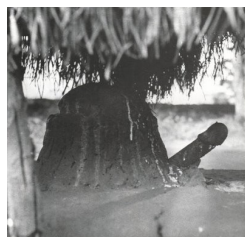
Orixá Exu cultuado na África.

CUIDADO AONDE VOCÊ PISA, CUIDADO COM O QUE PEDE, PORQUE A LEI DO RETORNO É IGUAL PARA TODOS: